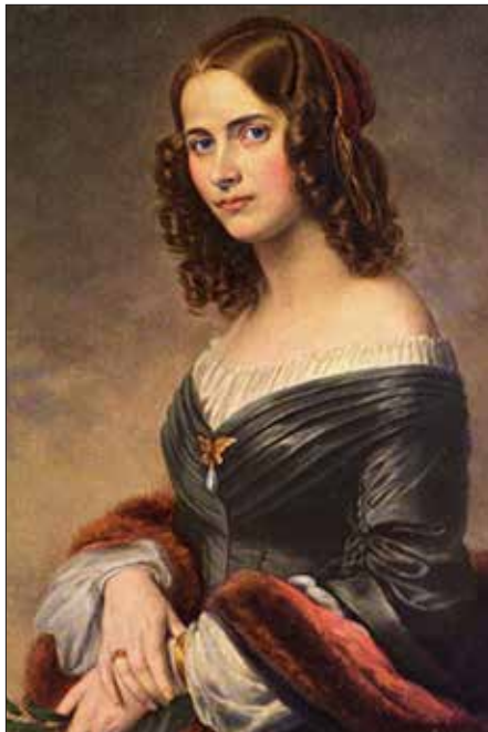
Fanny Hensel (1805 – 1847)

Fanny Hensel, geborene Mendelssohn (1805–1847), und ihr Bruder Felix Mendelssohn Bartholdy (1809–1847) verbindet eine außergewöhnliche und enge Beziehung, die sowohl von familiärer Zuneigung als auch von ihren gemeinsamen musikalischen Begabungen geprägt war. Im Laufe ihres Lebens sollte sich jedoch zeigen, dass der Zugang zur musikalischen Öffentlichkeit der beiden Wunderkinder von den gesellschaftlichen Erwartungen ihrer Zeit geprägt war. Während Felix als Mann alle Möglichkeiten offenstanden, seine Musik in den großen