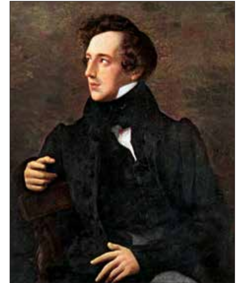
Felix Mendelssohn Bartholdy (1809 – 1847)

Die beiden Geschwister standen in einem komplexen Spannungsverhältnis zu Glauben und Religion, das sowohl durch ihre familiäre Herkunft als auch durch die gesellschaftlichen Gegebenheiten des 19. Jahrhunderts geprägt war. Geboren in eine jüdische Familie, die durch den berühmten Grossvater und Philosophen Moses Mendelssohn intellektuell und kulturell geprägt war, erlebte sie früh die Spannung zwischen jüdischer Herkunft und christlicher Mehrheitsgesellschaft. Ihre Eltern entschieden sich für die evangelische Taufe ihrer Kinder und nahmen den Familiennamen Bartholdy an, um die soziale Integration in die christlich geprägte Gesellschaft zu erleichtern. In einer Zeit, in der Antisemitismus in Europa weit verbreitet war, war ihre Familie jedoch trotz der Taufe nicht vollständig von Diskriminierung und Vorurteilen befreit. Für Fanny und Felix war die Religion daher nicht nur eine Frage des persönlichen Glaubens, sondern auch ein Symbol für die Herausforderungen der sozialen Zugehörigkeit und Identität. Beiden war nicht sehr daran gelegen, ihren Glauben öffentlich zu betonen. Lieber gaben sie ihren spirituellen und religiösen Empfindungen in ihren Kompositionen Ausdruck, die von einer tiefen Verwurzelung in der christlichen Tradition zeugen.