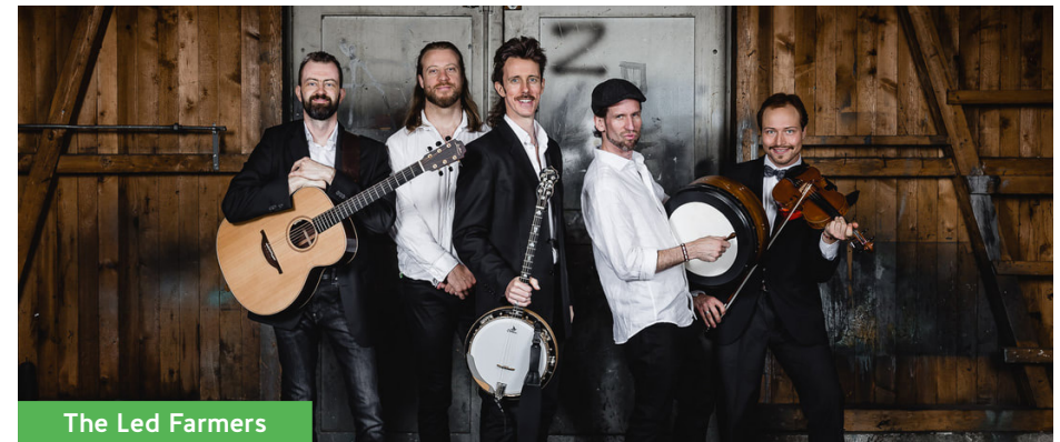
The Led Farmers

The Led Farmers sind eine Irish Folk Rock Band aus Irland und der Schweiz. Die meisten Bandmitglieder haben einen universitären Musikabschluss – ein Bandmitglied wurde sogar zweimaliger „All Ireland Music Champion“. Auf ihren Tournéen quer durch die USA und Europa erntete die Band sehr viel Beifall als eine der besten Irischen Live Acts. Ihr Repertoire umfasst viele Irish Folk Klassiker. Besonders viele positive Rückmeldungen haben sie jedoch für ihre eigenen Kompositionen und die neu arrangierten Songs irischer Musik erhalten.